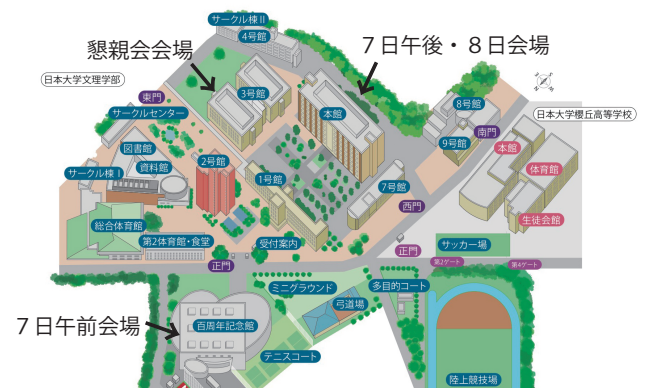
日本大学文理学部キャンパスマップ